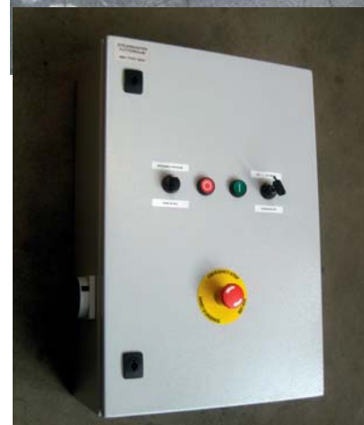
Schaltkasten MB1 für die Futterzentrale.