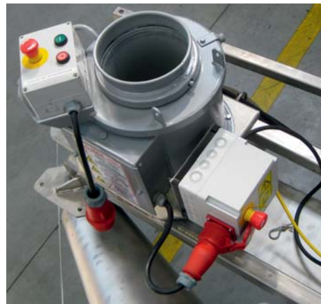
Es befinden sich 2 Steuerkästen an der Fräse mit Bedienknöpfen und Not-Aus-Schalter.

Beim Befüllen von CCM-Silage ändert sich die Drehrichtung sowohl der Walzen als auch der Schnecke. Es muss kein einziger Teil abmontiert werden. Nur umschalten auf Befüllen – fertig!