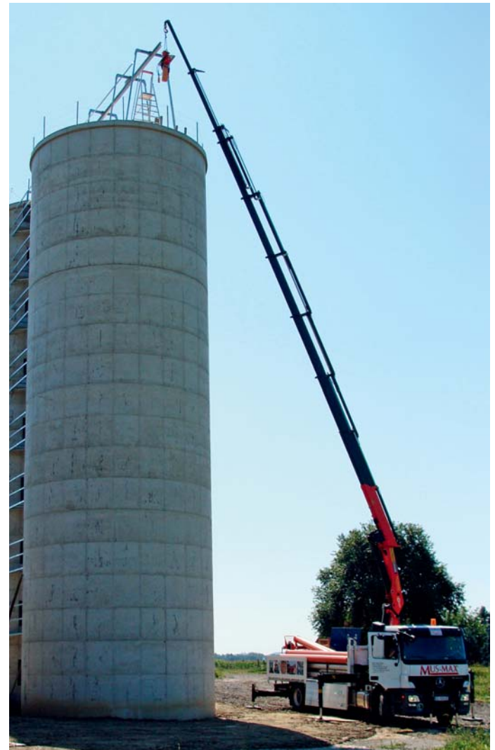
Die Krananlage und die Förderleitungen werden mit dem firmeneigenen Kranwagen montiert.