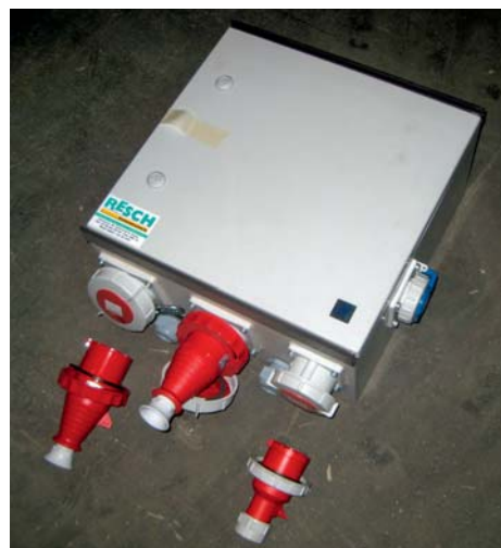
Der Verteilerkasten wird am Silo oben am Geländer fixiert: für Fräse, Licht und elektr. Kettenzug.