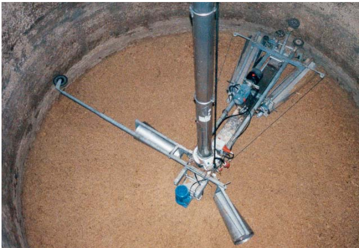
HMSB 600-Fräse im Entnahme-Einsatz bei Maishäckselilage (Verteilen nicht möglich).