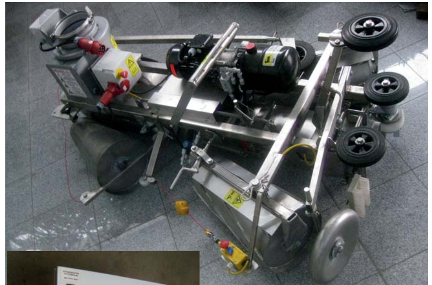
Seilzugschalter für Not-Stop-Einrichtung bei Typ HMSB 350.