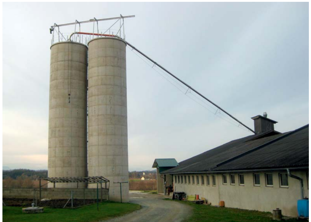
Moderne Silofräsanlage mit Kranbahn, elektrischem Aufzug, Niro-Ablaufleitung und Turbo-Zyklon am Dach des Stalles. (Für Turbo-Zyklon eigener Prospekt vorhanden.)