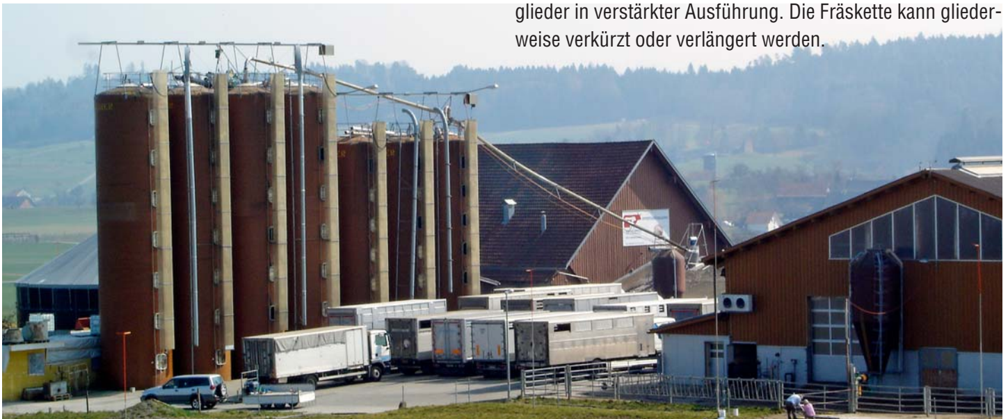
Gewaltige Saugleitungen bis zu 70 m sind mit dem neuen Edelstahl-Turbo-Zyklon erreichbar.