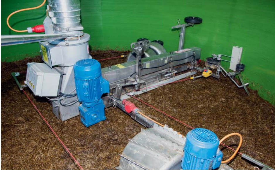
Exakte Wandreinigung durch Scheibensech und gezogener Bürste.

Die MUS-MAX Komet-Silofräse überzeugt durch eine gleichmäßige und sehr hohe Entnahmeleistung. Durch ihre einfache, wirkungsvolle Konstruktion wird sie den Anforderungen der modernen Siliertechnik optimal gerecht. Sie ist auch im Winter Einsatz bei besonders tiefen Temperaturen funktionssicher. Das Grundgerät ist ohne Werkzeug (mit Stecksplinte) im Baukastensystem zerlegbar. Der Aus- und Einbau ist in wenigen Minuten auch bei einer Luke 60 x 80 cm möglich. Es sind Typen für Silodurchmesser von 2,50 bis 7,00 m lieferbar.